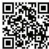
QR-Code Anmeldung: Zehntscheuer