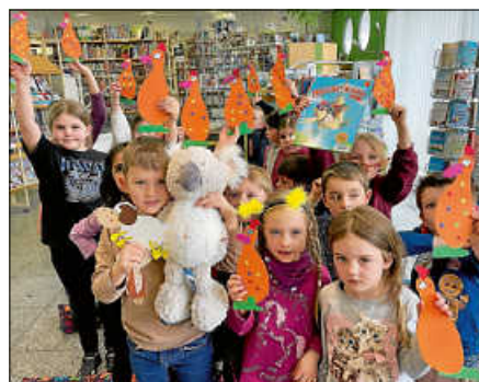
Plakat + Fotos: Andrea Goettel

Die nächste Zeit für Geschichten für Kinder ab 4 Jahren findet am Montag, 13. April um 15:30 Uhr statt.