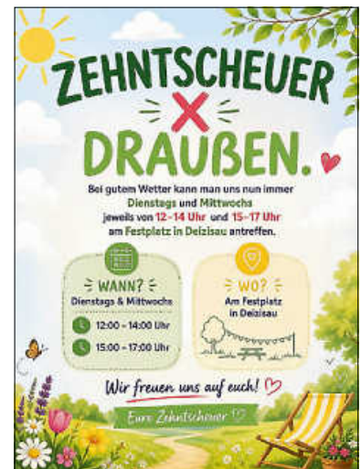
Plakat: Zehntscheuer Deizisau

... und die sonnige Jahreszeit geht wieder an den Start und weil wir uns die Sonne nicht nehmen lassen möchten – sogar noch viel lieber mit euch allen teilen würden –, werden wir bei bestem Wetter unseren offenen Bereich zum Festplatz verlegen. Wir freuen uns auf gemeinsame Momente und Gespräche unter klarem Himmel und schönstem Sonnenschein. Euer Zehntscheuer-Team