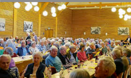
Rückblick auf Seniorenachmittag