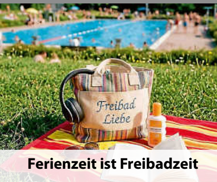
Ferienzeit ist Freibadzeit

Besuchen Sie uns unter www.deizisau.de und www.meindeizisau.de Diese Ausgabe erscheint auch online auf NUSSBAUM.de