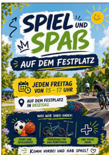
Plakat: Zehntscheuer Deizisau

Steigt bei uns aufs Zehntscheuer Fahrrad mit auf – Ich bin gespannt, wie viel wir dieses Jahr gemeinsam schaffen können. Mehr Infos auf der Homepage www.zehntscheuer-deizisau.de