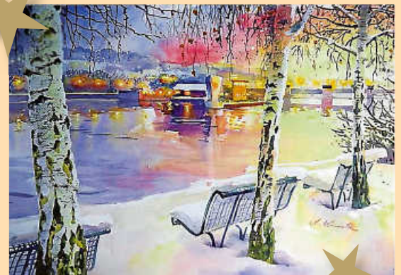
Nördliches Deizisauer Neckarufer