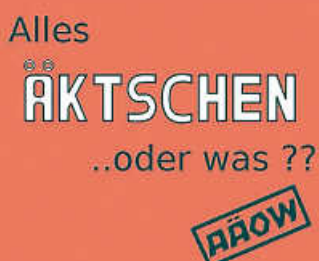
Samstag, 11. Juli