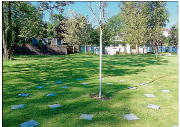
Neues Urnengrabfeld auf dem Friedhof (IV)