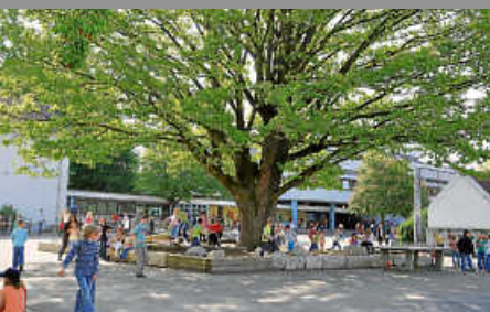
Kinder im Straßenverkehr

Besuchen Sie uns unter www.deizisau.de und www.meindeizisau.de Diese Ausgabe erscheint auch online unter www.eblaettle.de