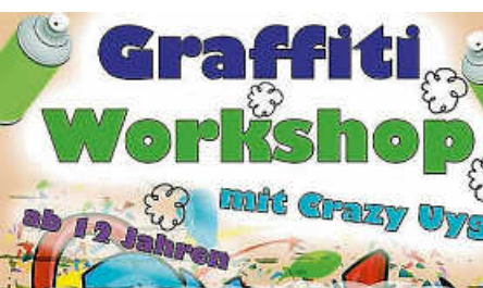
Freitag, 10. Juli