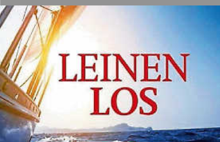
Sonntag, 5. Juli