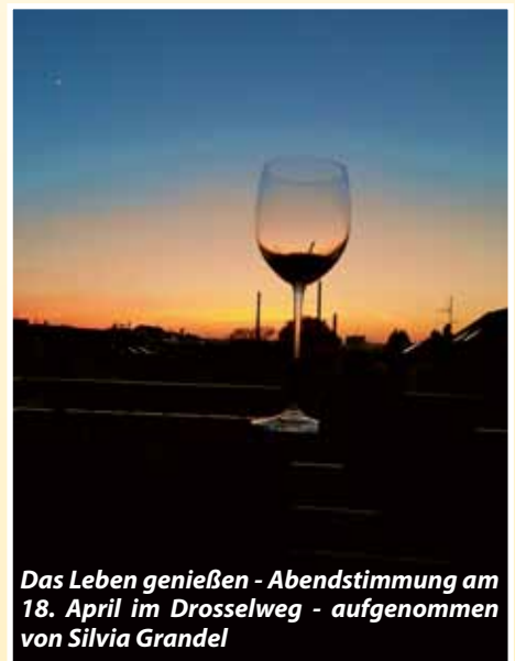
Das Leben genießen - Abendstimmung am 18. April im Drosselweg