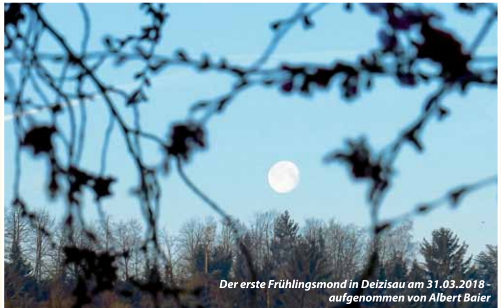
Der erste Frühlingsmond in Deizisau am 31.03.2018

Liebe Deizisauerinnen und Deizisauer, vor einem Jahr haben wir die Aktion "Bürgerfoto des Monats" ins Leben gerufen. Wir freuen uns sehr über die zahlreichen Bildzusendungen.