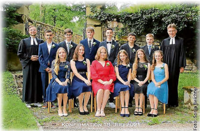
KONFIRMATION 18. JULI 2021