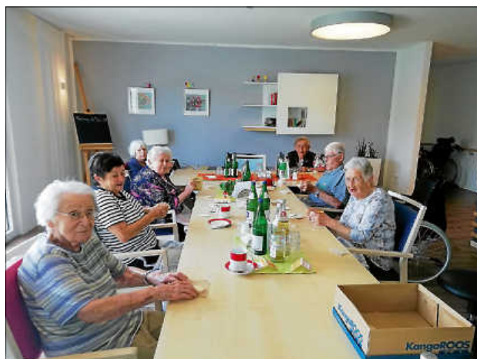
Fleißige Hände basteln Vogelfiguren