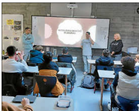
Berufliche Einblicke bei Coca Cola

Ein Dankeschön auch an die Gemeindeverwaltung Deizisau , die durch ihre finanzielle Unterstützung ermöglicht, dass unsere Schülerinnen und Schüler u.a. im Rahmen des Hametests vom Berufsausbildungszentrum Esslingen wichtige Kompetenzen zur Berufsfindung testen und weiterentwickeln können.