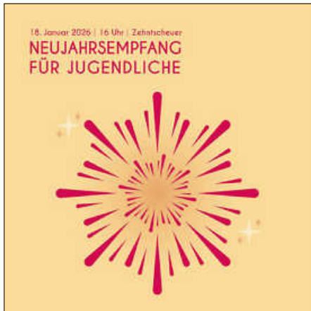
Grafik: Nora Nann