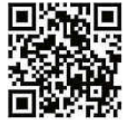
QR-Code Anmeldung: Zehntscheuer

Nummer gegen Kummer ist für Kinder, Jugendliche und Eltern bei Sorgen und Ängsten ein kompetenter und kostenloser Ansprechpartner.