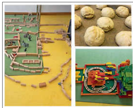
Pfingstferien 2026

Nach zwei Wochen voller Lachen und Entdeckungen sind die Kinder nun mit vielen Erinnerungen und ihren selbstgemachten Schätzen im Gepäck zurück in den Schulalltag gestartet.