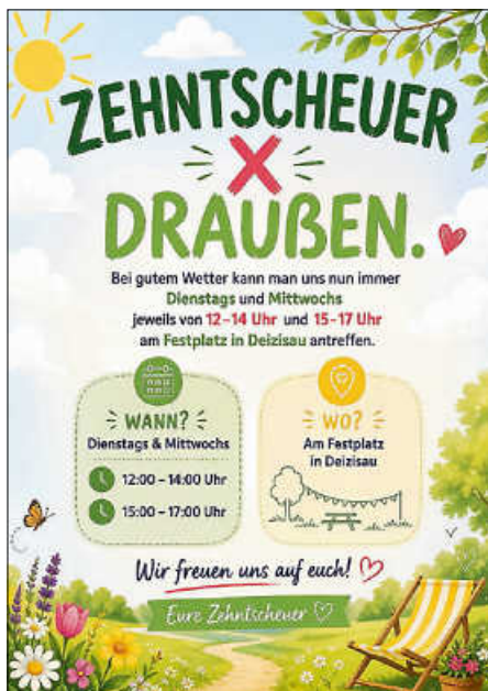
Plakate: Zehntscheuer Deizisau