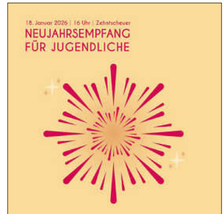
Grafik: Nora Nann