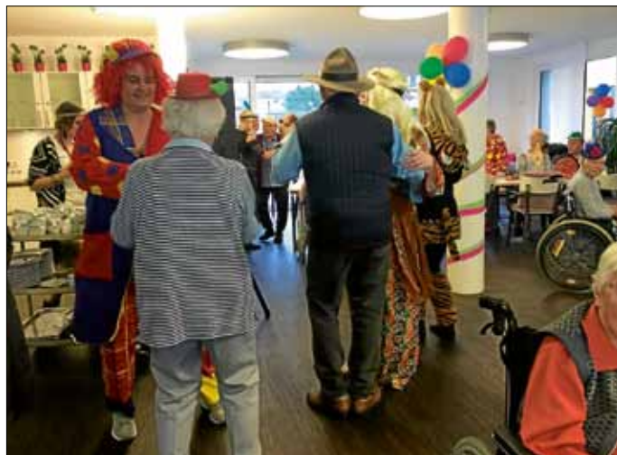
Die Bewohner hatten viel Freude an ihrer Fasnet.