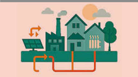
Kommunale Wärmeplanung am 12.12.2025