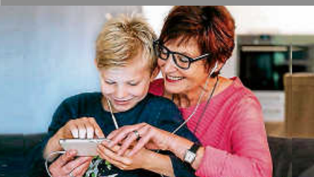
Smart Surfer – Kooperation mit der VHS