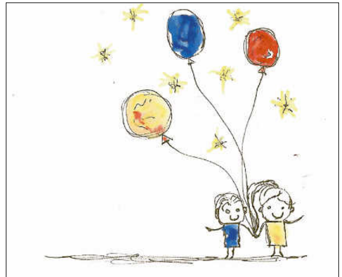
Grafik: Peter Hagenmüller

Kleine Herzenswünsche, schöne Wohlfühlmomente, ein spannender Ausflug, ein lustiger Abend, ein leckeres Essen, ein Gutschein für einen angesagten Klamottenladen – manchmal gibt es Wünsche, die so viel Freude bereiten würden, doch es wird niemals die Gelegenheit geben, dass sich dieser Wunsch erfüllt! Oder vielleicht doch?