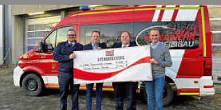
Spendenübergabe an die Freiwillige Feuerwehr Deizisau

Besuchen Sie uns unter www.deizisau.de und www.meindeizisau.de Diese Ausgabe erscheint auch online auf NUSSBAUM.de