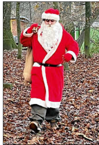
Da stapft der Nikolaus durch den Wald

In der Gruppe werden aus geschrammelten Songs nicht nur oftmals vielschichtige Klangperlen, das Zusammenspiel mit anderen bringt den einzelnen auch voran im Halten von Takt und Rhythmus, im Solospiel und im Erlernen der vielfältigen Möglichkeiten, die diese Instrumente bieten. Der Spaß kommt dabei selbstverständlich ebenfalls nicht zu kurz.