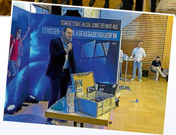
Auch fand im November die bereits 10. Deizisauer Ausbildungsplatzbörse statt, an der 31 Aussteller teilnahmen.