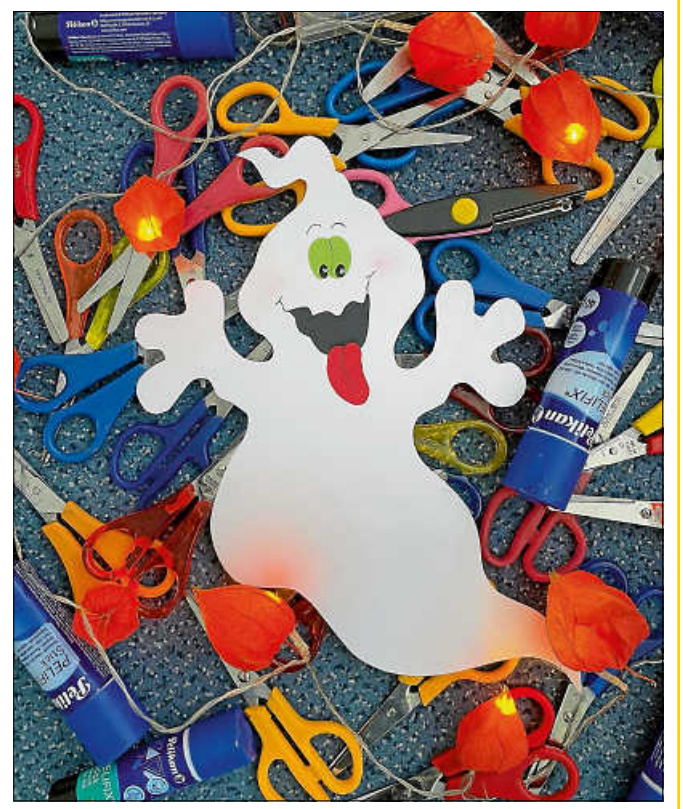
Vielleicht gibt es auch noch Süßes oder Saures ...