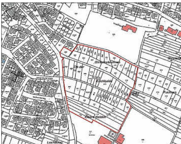
Lageplan vom 04.10.2022

Der räumliche Geltungsbereich bestimmt sich nach dem Abgrenzungsplan der Gemeinde Deizisau vom 04.10.2022, der Bestandteil dieser Satzung ist. Der Geltungsbereich ist in nachfolgendem Kartenausschnitt, der für den räumlichen Geltungsbereich dieser Satzung maßgebend ist, festgelegt: