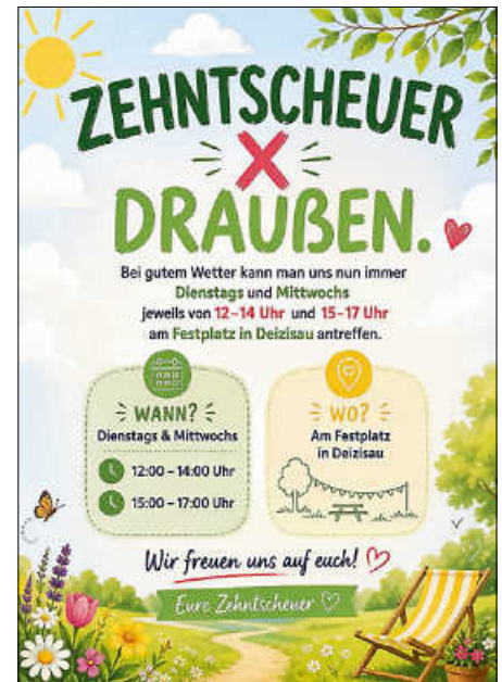
Plakate: Zehntscheuer Deizisau