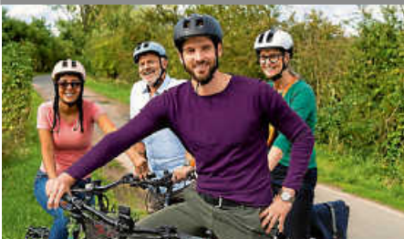
STADTRADELN 13.06. bis 03.07.2026