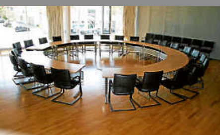
Bericht aus dem Gemeinderat