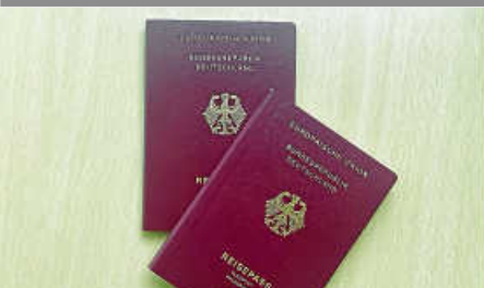
Reisezeit - Ausweise rechtzeitig beantragen