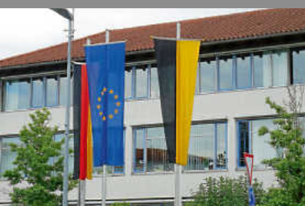
Befragung zum 09. Mai