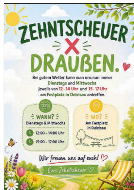
Plakate: Zehntscheuer Deizisau