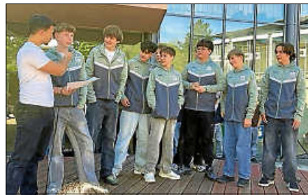
Das Team wird im Pausenradio ausgezeichnet.

Herzlichen Glückwunsch zu diesem herausragenden Erfolg!