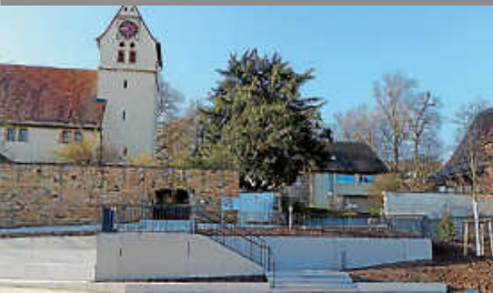
Einladung zur Einweihung des Kirchplatzes