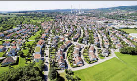
Befragung zum neuen Mietspiegel