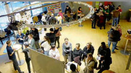
Rückblick Infoveranstaltung Kinderbetreuung