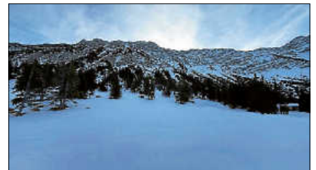
Traumhaftes Wetter im Oberjoch