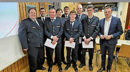
Rückblick Hauptversamm- lung Freiwillige Feuerwehr