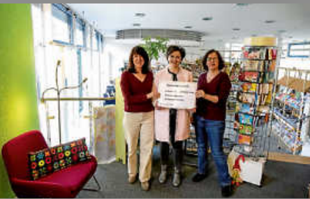
Spende für die Bücherei

Besuchen Sie uns unter www.deizisau.de und www.meindeizisau.de Diese Ausgabe erscheint auch online auf NUSSBAUM.de