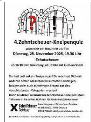
Plakat: Jens Lampart

Damit die grauen Zellen richtig in Fahrt kommen, wird ab 19 Uhr eine Kürbissuppe mit Baguette als wichtiger Denkanstieher an der Theke kredenzt! Bitte unbedingt dran denken: Alle, die miträtseln möchten, müssen sich unbedingt in der Zehntscheuer anmelden. Und: es sind nur noch wenige Plätze verfügbar!