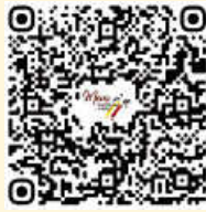
QR-Code zum Sepa-Lastschriftmandat