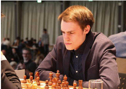
Foto: Europameister Matthias Blübaum wird wieder für Deizisau auf Punktejagd gehen (Foto: Schachbundesliga e.V.).

Sonntag, 27. November 2022 ab 10 Uhr SC Remagen Sinzig – SF Deizisau SC Viernheim – FC Bayern München