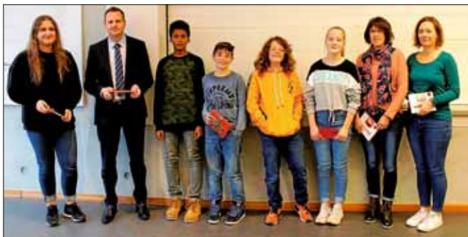
Sieger und Jury des Vorlesewettbewerbs im Schuljahr 2018/19