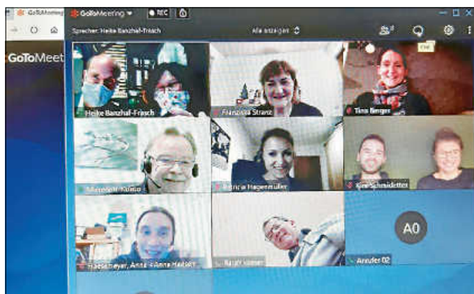
Nichts kann uns aufhalten :-): Erstes Online-Meeting des Fit4Job-Teams

Fit4Job ist nun Teenie – herzlichen Glückwunsch! Seit rund dreizehn Jahren begleiten ehrenamtliche Patinnen und Paten aus ganz unterschiedlichen Arbeitsfeldern und mit verschiedenen Vorerfahrungen Schülerinnen und Schüler der Gemeinschaftsschule im Übergang Schule – Beruf.