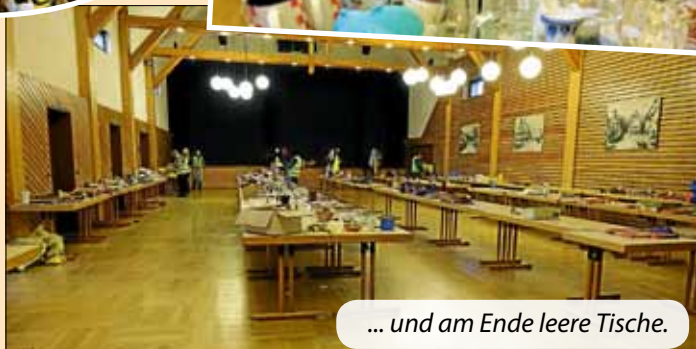
... und am Ende leere Tische.