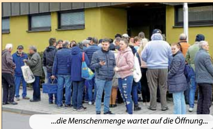
...die Menschenmenge wartet auf die Öffnung...