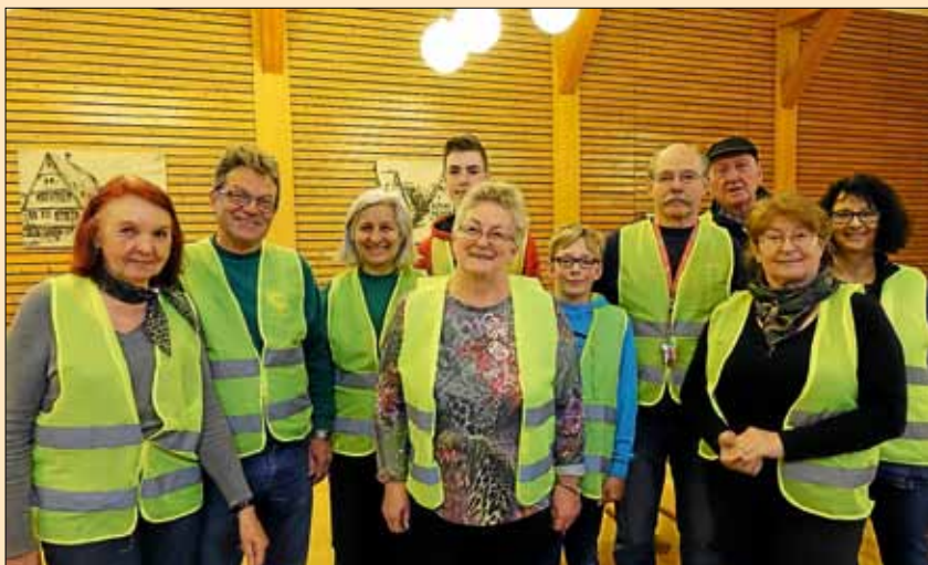
Ein Teil der Helfer - gut erkennbar durch die Warentauschtag-Westen

Der Deizisauer Warentauschtag ist nach wie vor beliebt und weit über die Gemeindegrenzen hinaus bekannt.