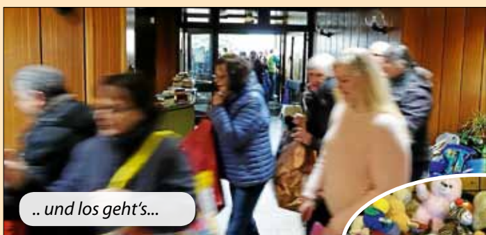
.. und los geht's...

Ein herzliches Dankeschön an alle Helferinnen und Helfer, den Bauhof für den Aufbau, das DRK fürs Abholen der übrig gebliebenen Bücher und den Albverein für die Bereitstellung des Vereinszimmers.