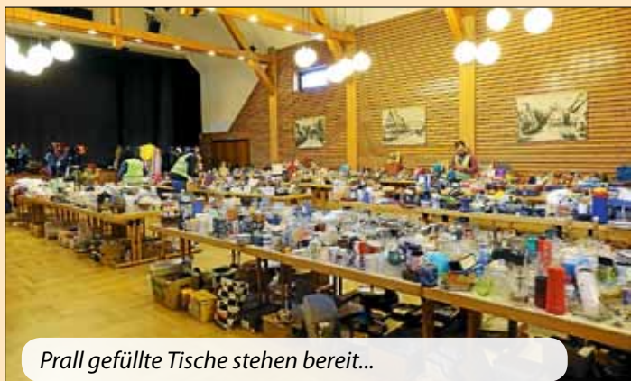
Prall gefüllte Tische stehen bereit...

Die an der Pinnwand angebotenen sperrigen Gegenstände werden über die Tauschbörse in der Zehntscheuer im Mitteilungsblatt veröffentlicht.