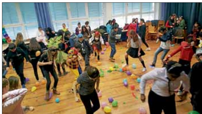
Ausgelassene Stimmung bei der Faschingsdisco