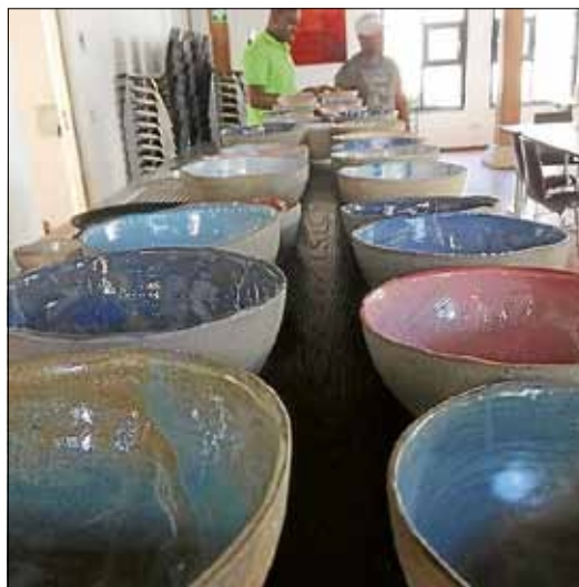
Produkte aus der Keramikwerkstatt

Das CAR Projekt stellt in seinen Werkstätten neben den verschiedenen, hochwertigen Seifen auch weitere Produkte her. So entstehen in der Keramikwerkstatt, Schüsseln, Teller und Seifenschalen, in der Nähwerkstatt Taschen für verschiedene Zwecke aus afrikanischen Stoffen und in der Holzwerkstatt aktuell Insektenhäuser aus Holz. Diese Gegenstände werden von den Teilnehmern aus aller Welt mit viel Liebe und Herz hergestellt und können auf dem Herbst- und Weihnachtsmarkt erworben werden.