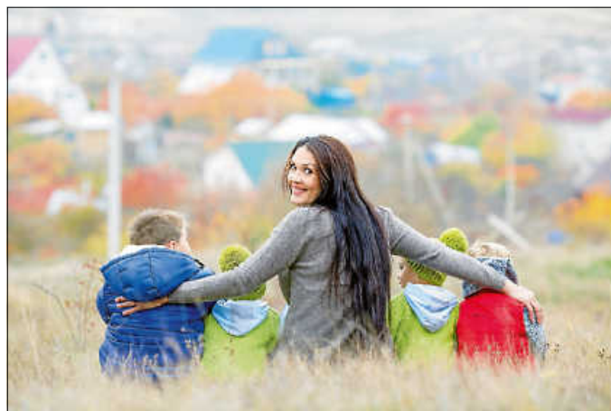
Kinder machen unser Leben bunter!

Der nächste Qualifizierungskurs startet dieses Jahr im März in Denkendorf. Die Qualifizierung ist in Kurs I (vorbereitende Qualifizierung mit 50 UE) und Kurs II (praxisbegleitende Qualifizierung mit 250 UE) gegliedert. Pädagogische Fachkräfte (nach § 7 KiTaG) sind bereits nach Kurs I vollumfänglich qualifiziert. Die Teilnahme an der gesamten Qualifizierung ist auf Wunsch jederzeit möglich. Vor Kursbeginn und nach Kurs I findet ein Eignungsgespräch mit dem Tageselternverein statt. Bei Interesse an der Qualifizierung zur Tagespflegeperson melden sich interessierte Personen möglichst zeitnah bei der für ihren Wohnort zuständigen Ansprechpartnerin des Tageselternvereins. Diese finden Sie auf unserer Homepage unter www.tev-kreis-es.de .