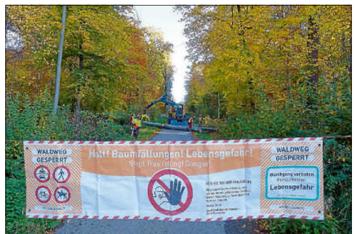
Absperrungen müssen von Waldbesuchern unbedingt eingehalten werden. Sonst kann es schnell gefährlich werden.

Das hohe Tempo des von Menschen gemachten Klimawandels hinterlässt seine Spuren im langlebigen Ökosystem Wald. Viele alte Bäume, häufig Buchen, trocknen von der Krone her ab. Dürre Kronenteile können herabfallen und zur Gefahr für Waldbesucher und Forstarbeiter werden. Daher wird ein Schwerpunkt der winterlichen Arbeiten sein, die Waldwege begehbar zu halten. Besonders stark frequentierte Wege haben dabei Vorrang. Absterbende Bäume, die eine