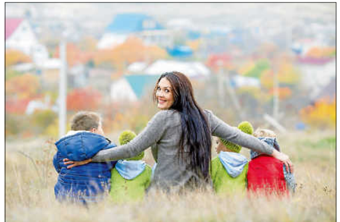
Mein Alltag mit Kindern - für mich das Schönste!

Der nächste Qualifizierungskurs startet dieses Jahr im Oktober in Denkendorf. Die Qualifizierung ist in Kurs I (vorbereitende Qualifizierung mit 50 UE) und Kurs II (praxisbegleitende Qualifizierung mit 250 UE) gegliedert. Pädagogische Fachkräfte (nach § 7 KiTaG) sind bereits nach Kurs I vollumfänglich qualifiziert. Die Teilnahme an der gesamten Qualifizierung ist auf Wunsch jederzeit möglich. Vor Kursbeginn und nach Kurs I findet ein Eignungsgespräch mit dem Tageselternverein statt. Bei Interesse an der Qualifizierung zur Tagespflegeperson melden sich interessierte Personen möglichst zeitnah bei der für ihren Wohnort zuständigen Ansprechpartnerin des Tageselternvereins. Diese finden Sie auf unserer Homepage unter www.tev-kreis-es.de