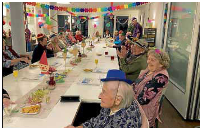
Die "wohl behüteten" Bewohner feiern den Fasnets-Dämmerchoppen