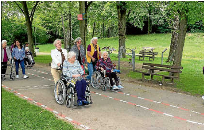
Die „Rollstuhlgruppe“ auf dem Weg zum Neckarufer

Wir bedanken uns im Namen der Bewohner bei allen Beteiligten für diese gelungene Informationsreise. Ohne den tatkräftigen Einsatz der sieben Alltagsbegleiter und vierzehn Ehrenamtlichen wären derartige Veranstaltungen undenkbar. Herzlichen Dank natürlich auch an unseren Robert.