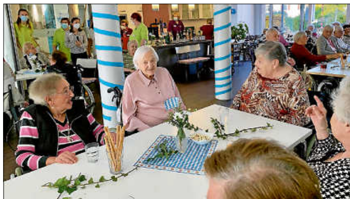
Die Bewohner gestalteten das Fest aktiv mit.