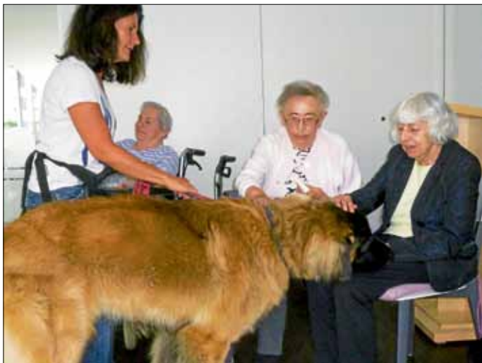
Balou sucht und findet die Nähe der Bewohner