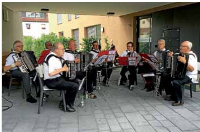
Die Montagsörgler begeisterten wieder einmal mit ihrem vielseitigen Programm