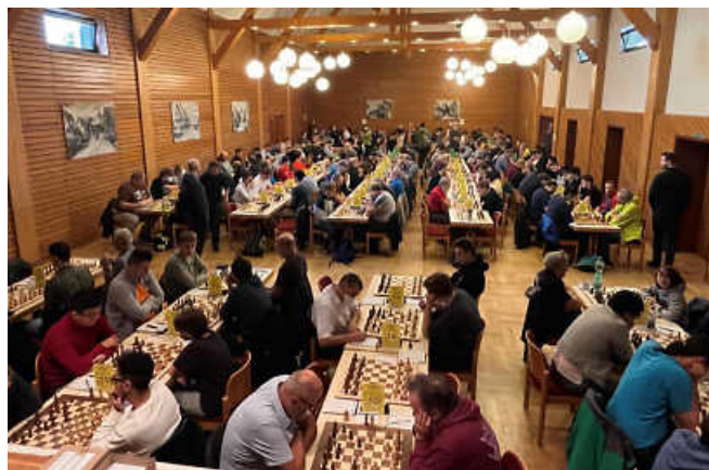
Foto: Volles Haus im letzten Jahr

Freitag, 27. Oktober bis Montag, 30. Oktober 2023 in der Gemeindehalle